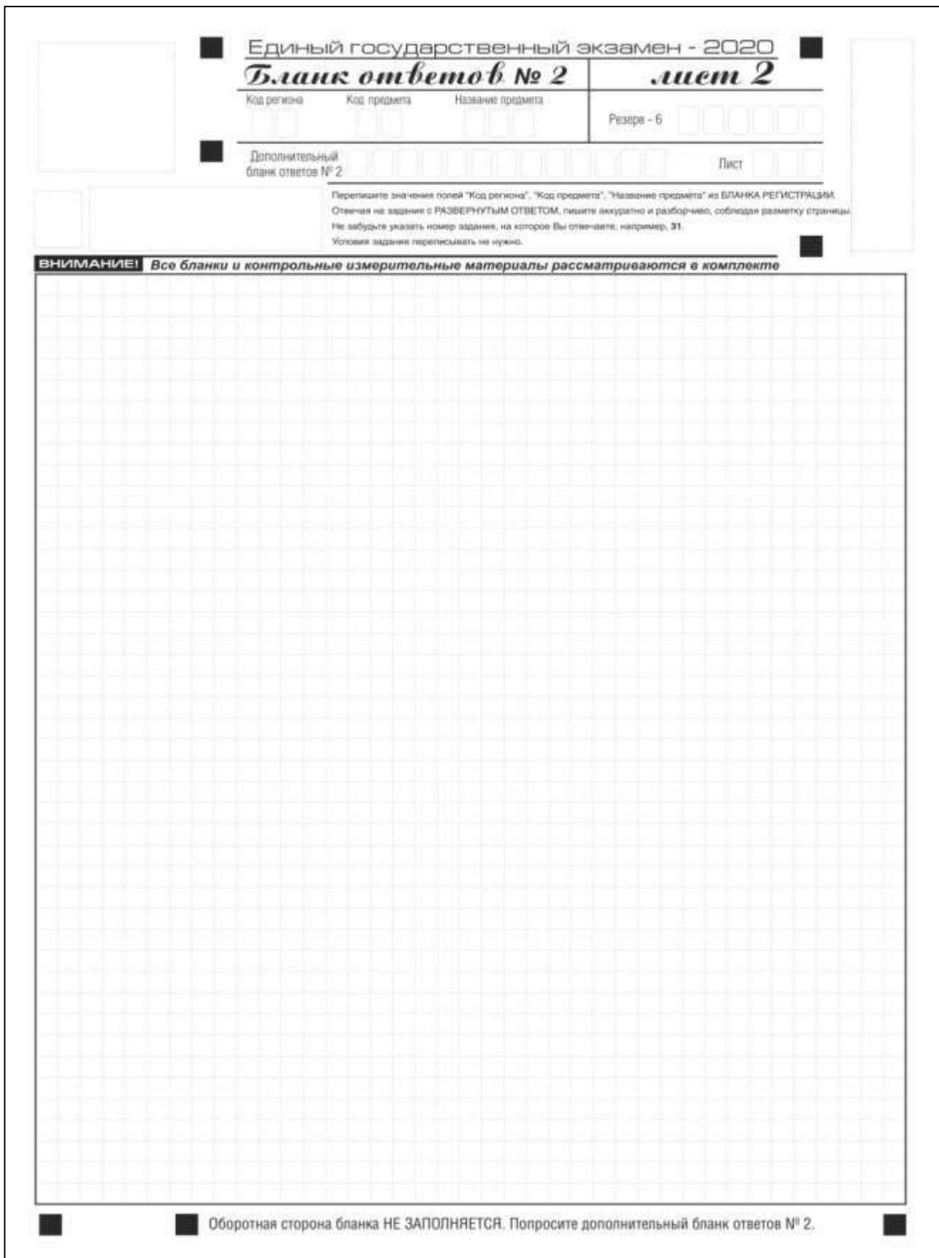
Рис. 11. Бланк ответов № 2 (лист 2)