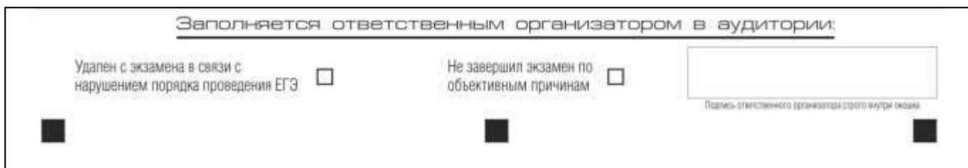
Рис. 6. Область для отметок организатора в аудитории о фактах удаления участника экзамена либо об окончании экзамена по уважительной причине

ВАЖНО!!! Одновременно два поля НЕ ЗАПОЛНЯЮТСЯ. Отметка ставится либо в поле «Удален с экзамена в связи с нарушением порядка проведения ЕГЭ», либо «Не завершил экзамен по объективным причинам». В случае удаления участника ГИА с экзамена в связи с нарушением Порядка в штате ППЭ в зоне видимости камер видеонаблюдения заполняется форма ППЭ-21 «Акт об удалении участника экзамена».