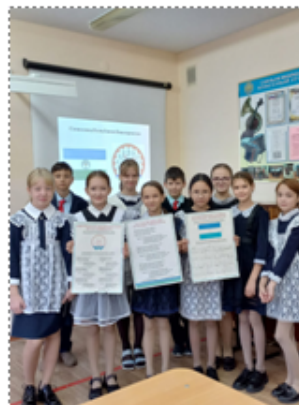
священные Дню Республики Башкортостан.

В целях формирования гражданско-патриотического воспитания подрастающего поколения, целостного представления о родном крае, воспитания познавательного интереса, любви к своей малой Родине 10 октября во всех классах состоялись классные часы на тему «Башкортостан - вчера, сегодня, завтра», посвященные Дню Республики Башкортостан.